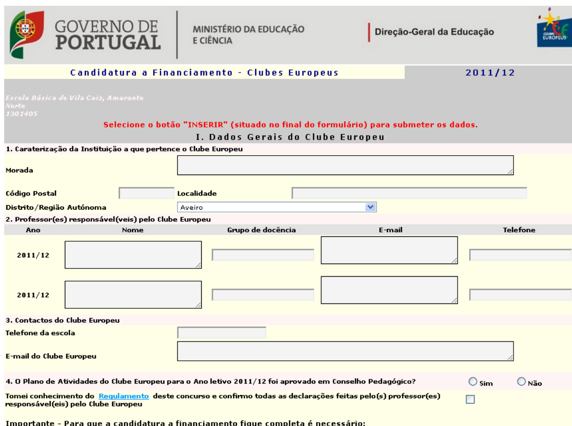
Figura 2 – Imagem do formulário “Dados Gerais do Clube Europeu”.